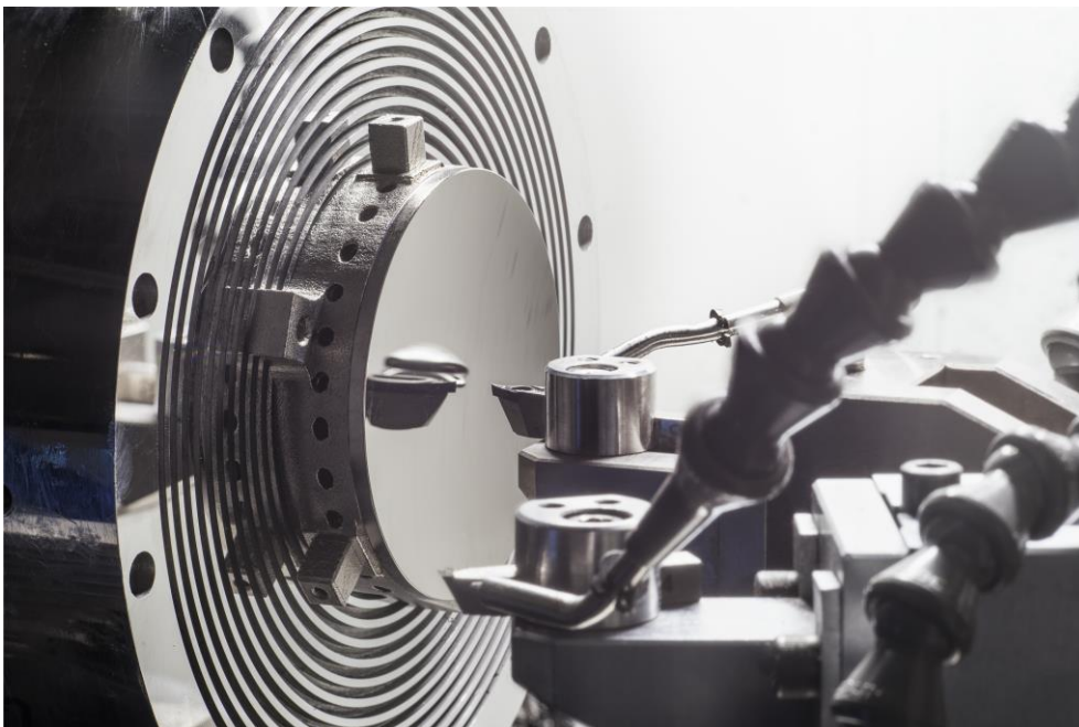
Bild 3) UP-Bearbeitung eines additiv hergestellten Leichtgewichtspiegels.