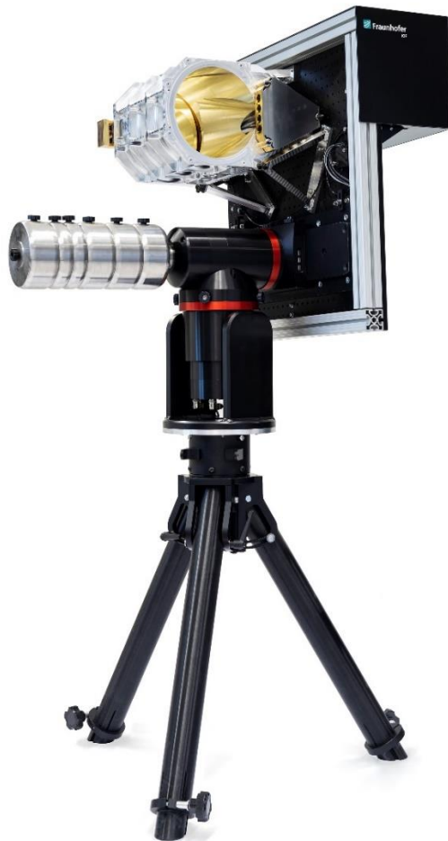
Abb. 2: Ein am Fraunhofer IOF entwickeltes Metallspiegelteleskop ermöglicht die kurzfristige Freistrahübertragung zwischen zwei Kommunikationspartnern. So wird z. B. die Quantenkommunikation innerhalb von Städten möglich.